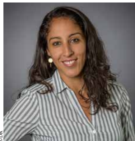
Sihame EL Amine, Directrice Qualité & Projets chez Deveryware

880 000 et 300 000 , ce sont actuellement le nombre de certifications ayant été attribuées à travers le monde, respectivement pour l'ISO 9001 (management de la qualité) et pour la 14001 (management de l'environnement).